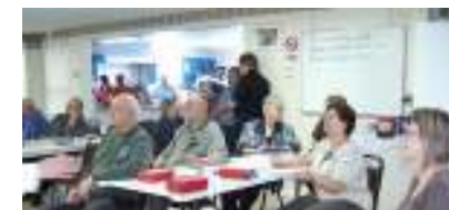
Tournoi fin de saison