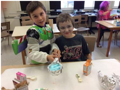
Fabrication de bonbons moussants pendant l'atelier de science