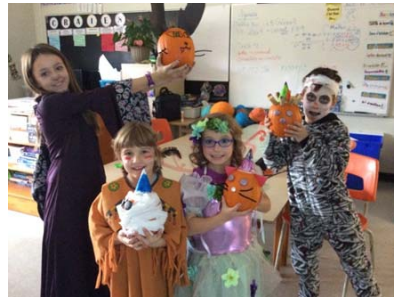
Décoration de citrouilles